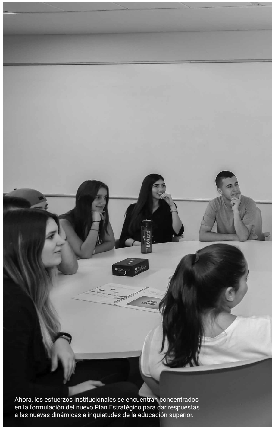
Ahora, los esfuerzos institucionales se encuentran concentrados en la formulación del nuevo Plan Estratégico para dar respuestas a las nuevas dinámicas e inquietudes de la educación superior.