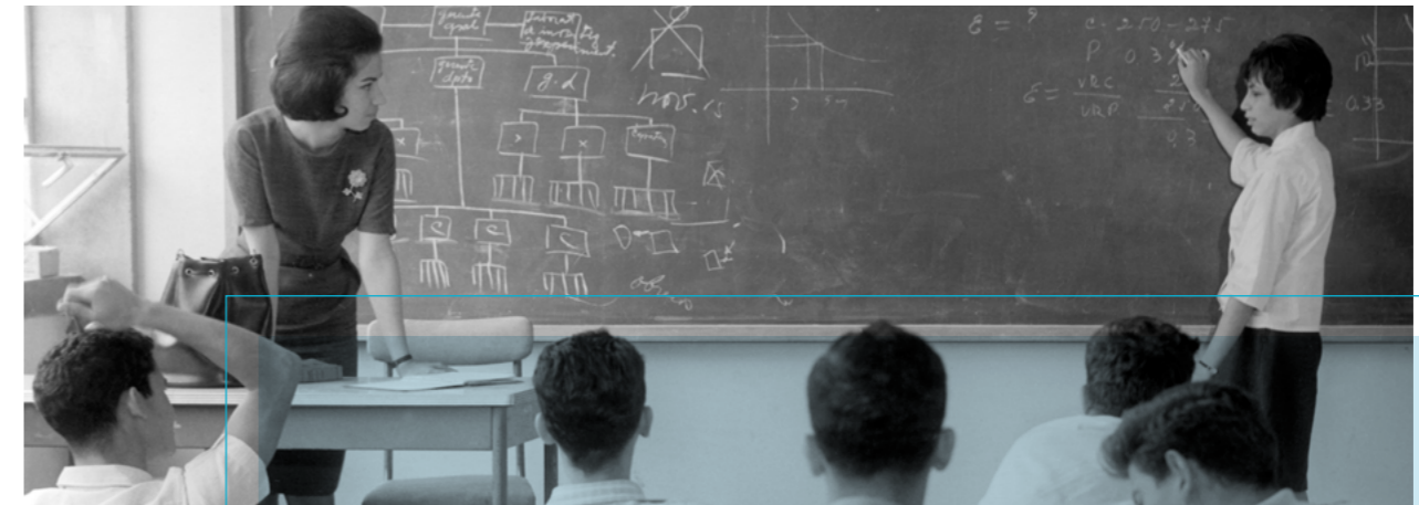
Clase de la Escuela de Administración y Finanzas (EAF), en los 60.

El hito fundacional de EAFIT, la respuesta a los cambios de la década de los 70s, la apertura económica de los 80s, la llegada de la tecnología o las nuevas metodologías de aprendizaje, hacen parte de este repaso, con el que reconstruimos 61 años de trayectoria eafitense.