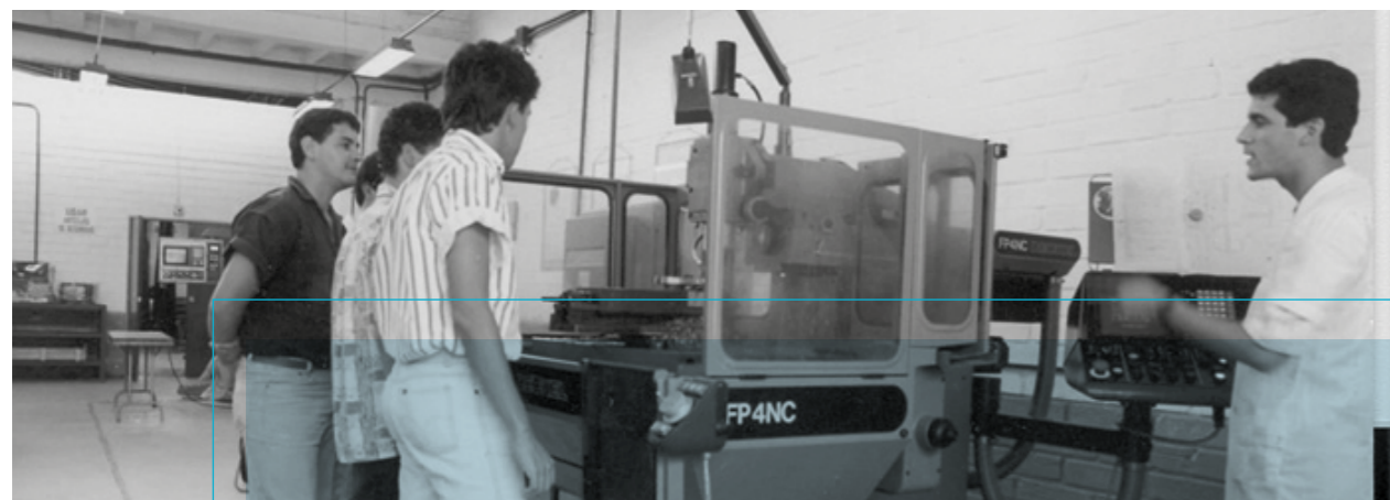
Centro de Laboratorios en la década del 80.