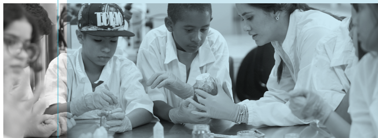
En los últimos años EAFIT le apunta a convertirse en una Universidad para todas las generaciones.

“Los ochenta y noventa también fueron una época marcada por la violencia del narcotráfico, por lo que no fue raro que en la segunda mitad de la década la Universidad centrara su mirada en el ser humano, con el nacimiento de la Escuela de Ciencias y Humanidades, el pregrado en Música, la Orquesta Sinfónica, las primeras publicaciones de la Editorial EAFIT o el edificio de la Biblioteca Luis Echavarría Villegas y su Centro de Artes”.