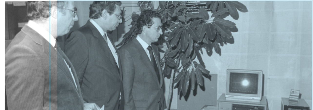
Inauguración del Centro de Cómputo en los 70.

Todo esto, además, de la mano de instituciones extranjeras como la Universidad de Syracuse (Estados Unidos), o la Fundación Whirlpool, lo que les permitió no solo leer la realidad local y regional, sino también alinearse con las dinámicas globales. De esta manera la EAF navegó con un solo programa de formación durante la mayor parte de la década, hasta que se enfrentó a un nuevo reto: las primeras señales de crisis de la industrialización.