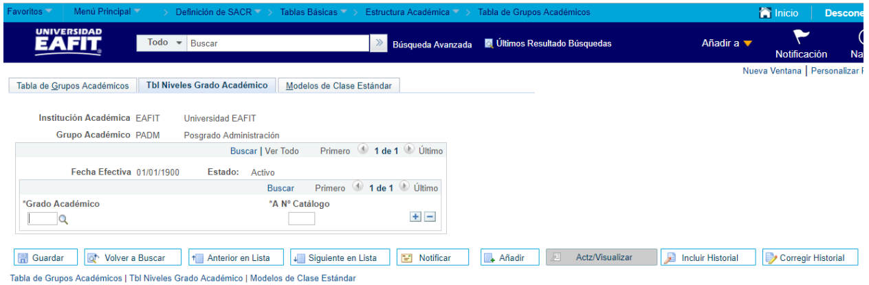
Imagen 2: Pestaña Tabla Niveles Grado Académico

De acuerdo a la Imagen 2 se describen los siguientes campos: