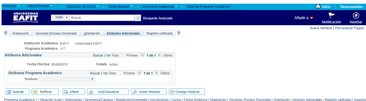
Imagen 12: Pestaña Atributos Adicionales.

Esta pestaña no se debe diligenciar, ya que no se contempló en el alcance. No aplica para EAFIT. Esta pestaña no tiene uso actual y no tiene validaciones.